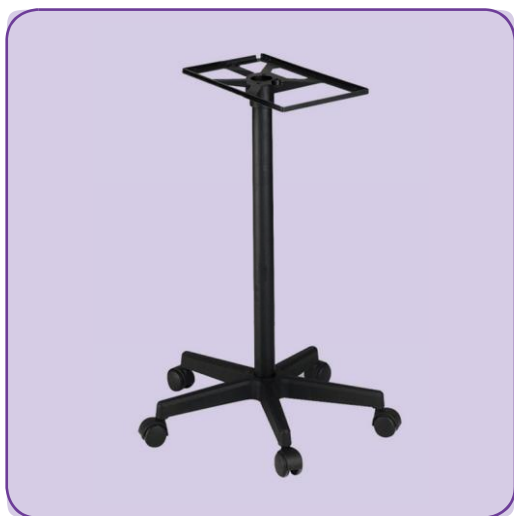
4 roues pivotantes (dont 2 roues avec freins)